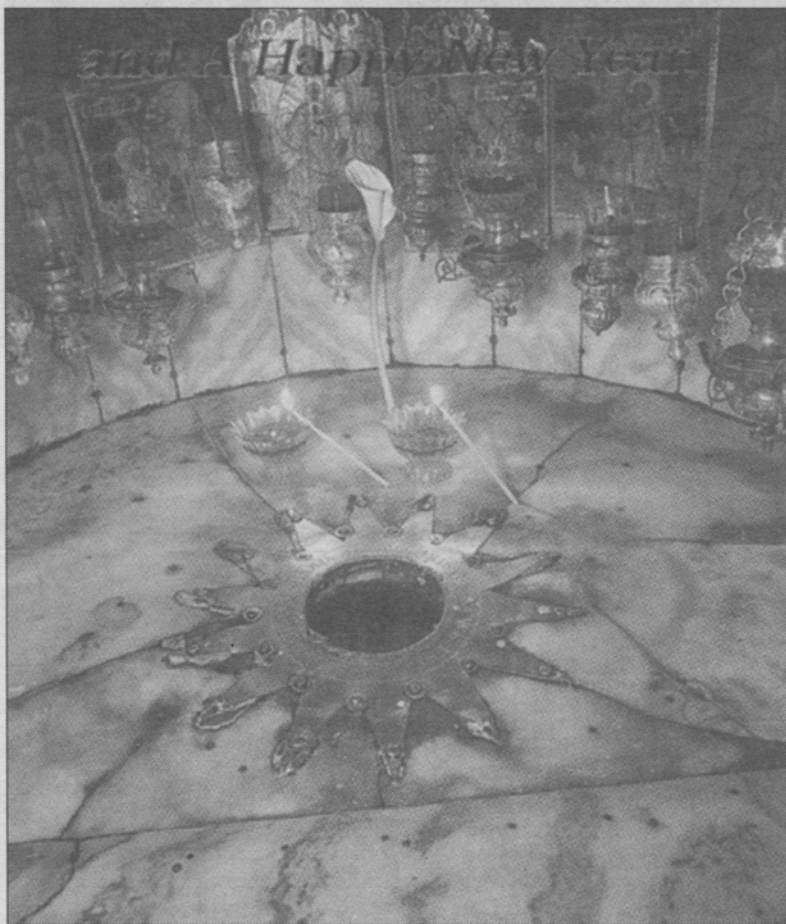
Betlehem-stjernen i Fødselskirken i Betlehem. Israelsmissionens Gave-shop forhandler dette julekort. Se side 6.

Selv om han er nær, er han dog fjern, hvis vi mener, at